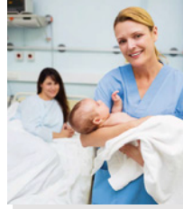
Hebamme / Entbindungshelfer